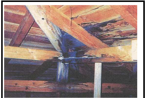
18 小屋組 漏水の跡