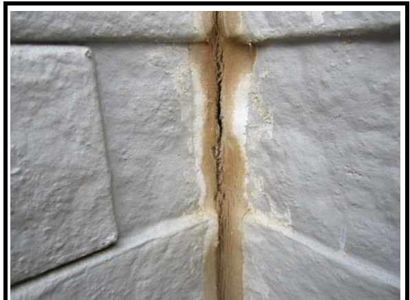
4 外壁 シーリングの状態