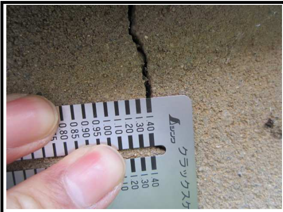
3 外壁 劣化状態(クラック等)