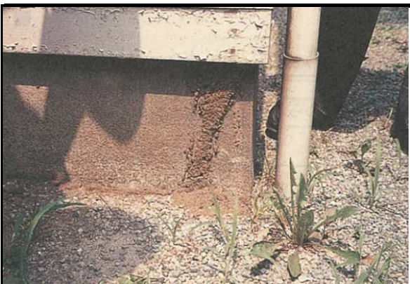
1 基礎 蟻害