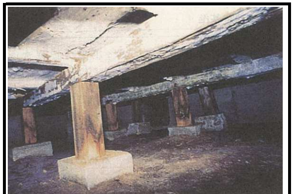
2 土台・床下 腐朽等