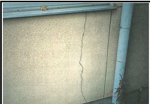
3 外壁 劣化状態(クラック等)