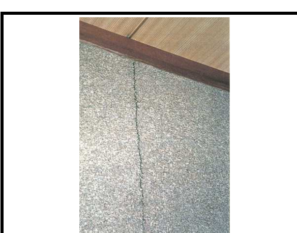
33 内壁 劣化状態(クラック等)