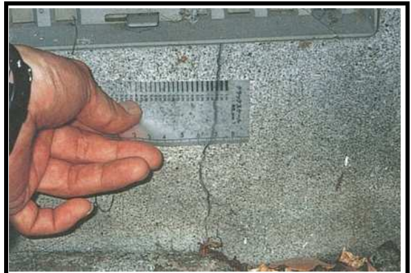
2 基礎 幅0.5mm以上のクラック