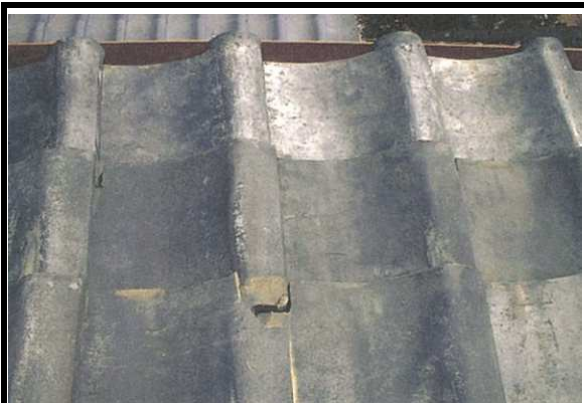
17 屋根 屋根材の破損等