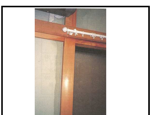
32 内壁 漏水の跡