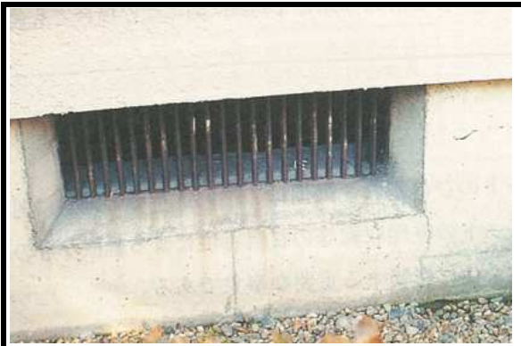
1 基礎 幅0.5mm未満のクラック